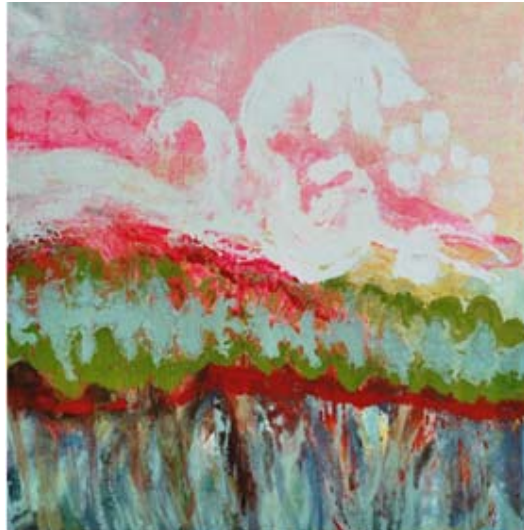
... zur Spiel- und Kulturpassage Rosa-Aschenbrenner-Bogen 9/o