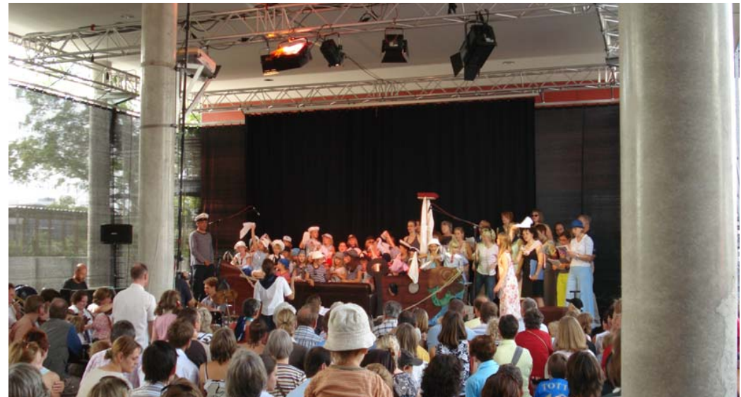
Foto: Eröffnung der Spiel- und Kulturpassage am 1.7.2007

Projektteam Spiel- und Kulturpassage in wagnis e.V.