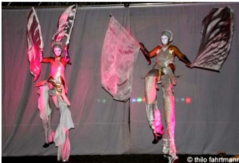
... am Ackermannbogen