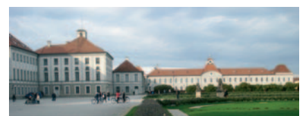
Endpunkt der Grünen Achse: Der Nymphenburger Park