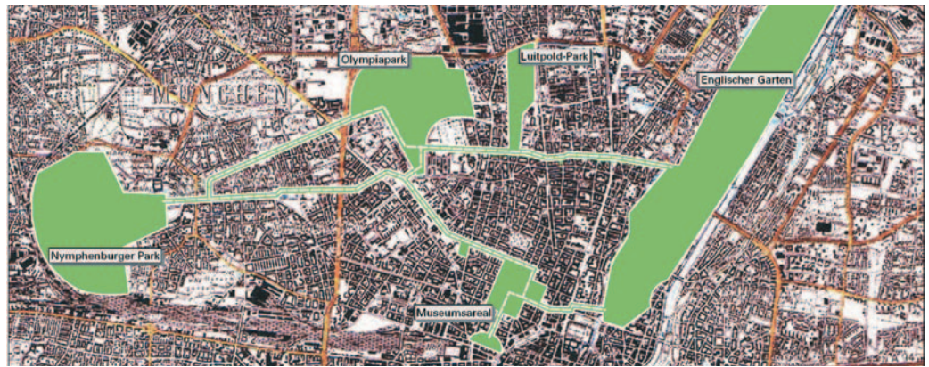
Grüne Achse = Kultur- und Naturmeile als Verbindung von Großparks: Englischer Garten - Luitpold Park - Olympiapark - Nymphenburger Park mit Abstechern zum Museumsareal

Von der Grünen Achse zum Natur- und Kulturpfad