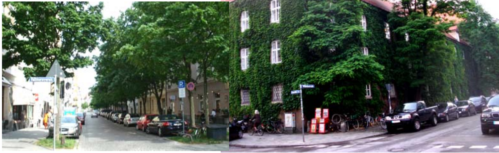
Clemensstraße / Ecke Fallmerayerstraße