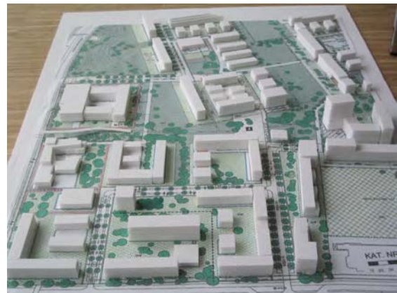
Vorschlag der Bürger im FORUM